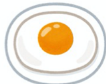
たまご料理 (砂糖を入れない)