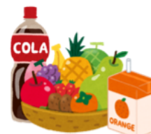
ジュース類 フルーツ