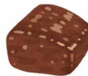
肉類 (ソース・タレは使わない)